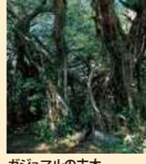
ガジュマルの古木

平家伝説ゆかりの史跡。かつて平家の落人が、都からの追手を監視するために作った大きな洞窟だと言われています。