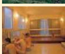
友の花温泉保護センター

かこしま百景にも選ばれたビューポイント。どこまでも続く青い空と海を一望することができます。