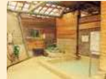
東区温泉・西区温泉

乳白色のミョウバン・硫黄・塩分を含んだ天然温泉。心地よい波音を聞きながら入浴できる、おすすめの温泉です。