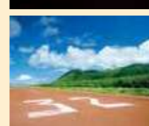
諏訪之瀬島場外離着陸場

切石港を右手に向かうと見える、幻想的な洞窟。トカラ列島の島々に伝わる乙姫伝説に彩られています。