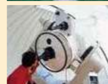
中之島天文台(要予約)

七ツ海岸線や御岳から口之島まで見渡せる、素晴らしい眺望を誇る灯台。灯台下は磯釣りのポイントにもなっています。