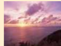
元浦港付近の夕日

美しい夕日に出会える、絶景ポイント。島ならではの低い雲を目の前に、遠くには平島も見ることが出来ます。