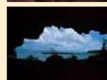
乙姫の洞窟と切石港

美しい夕日に出会える、絶景ポイント。島ならではの低い雲を目の前に、遠くには平島も見ることが出来ます。