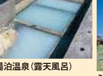
湯泊温泉(露天風呂)

サンゴ岩でできた海水浴場。透明度が高いので、シュノーケリングなどに最適。浅い場所では、魚や貝なども観察できます。