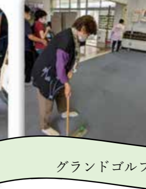
グランドゴルフ大会